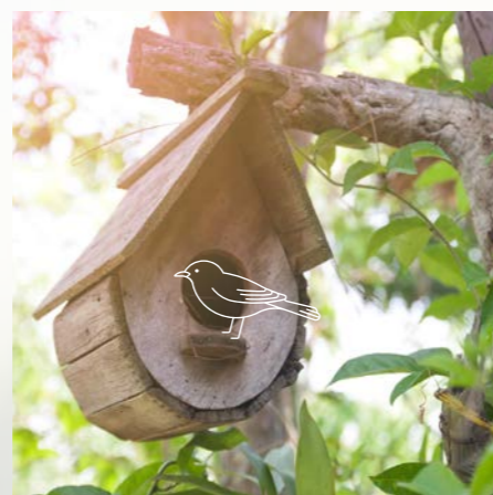
Nichoir à oiseaux