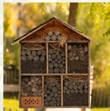
Hôtel à insectes