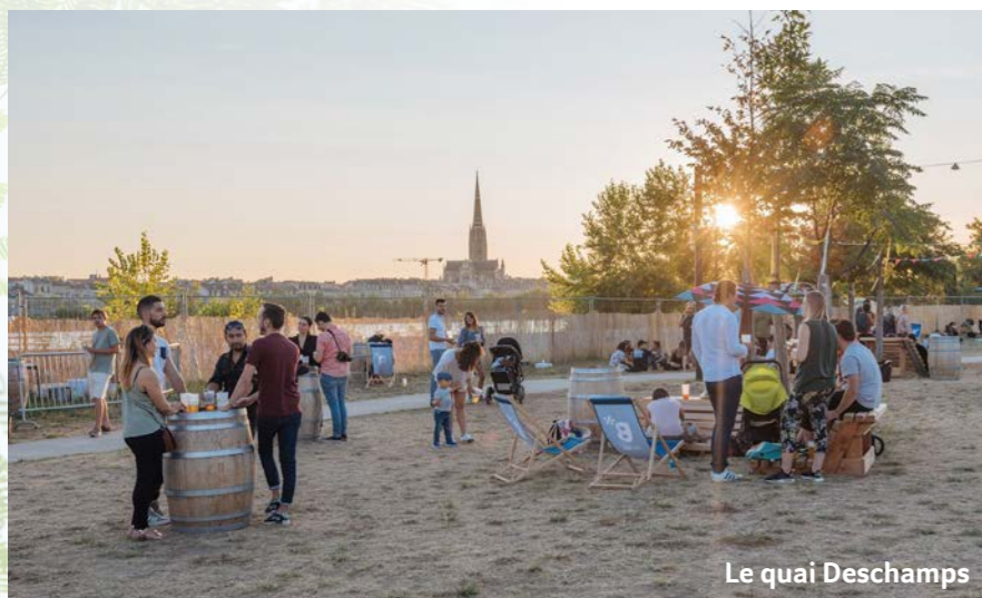
Le quai Deschamps