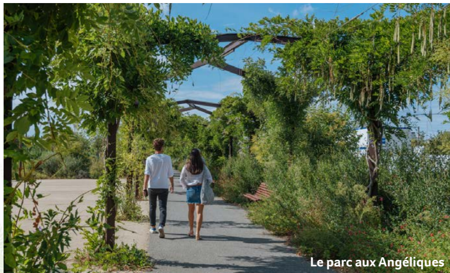
Le parc aux Angéliques