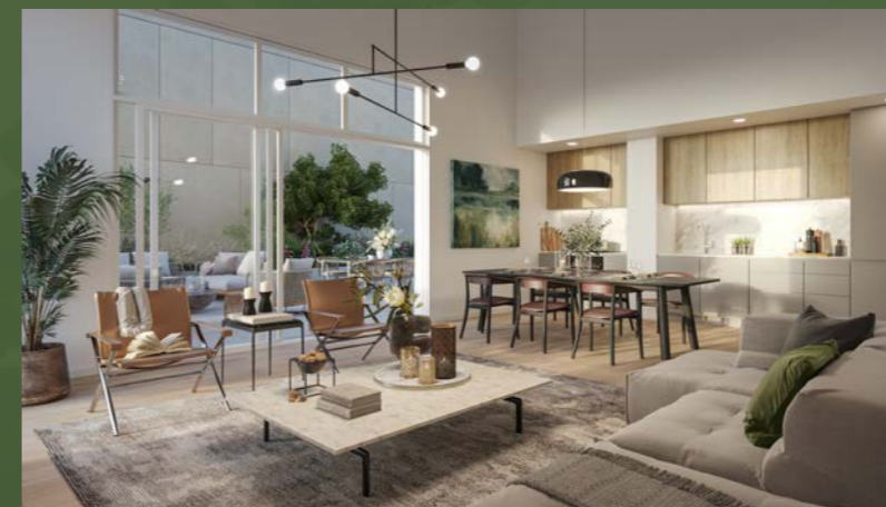
Visuel 3D réalisé à partir des plans d'architecte de l'appartement N°A61