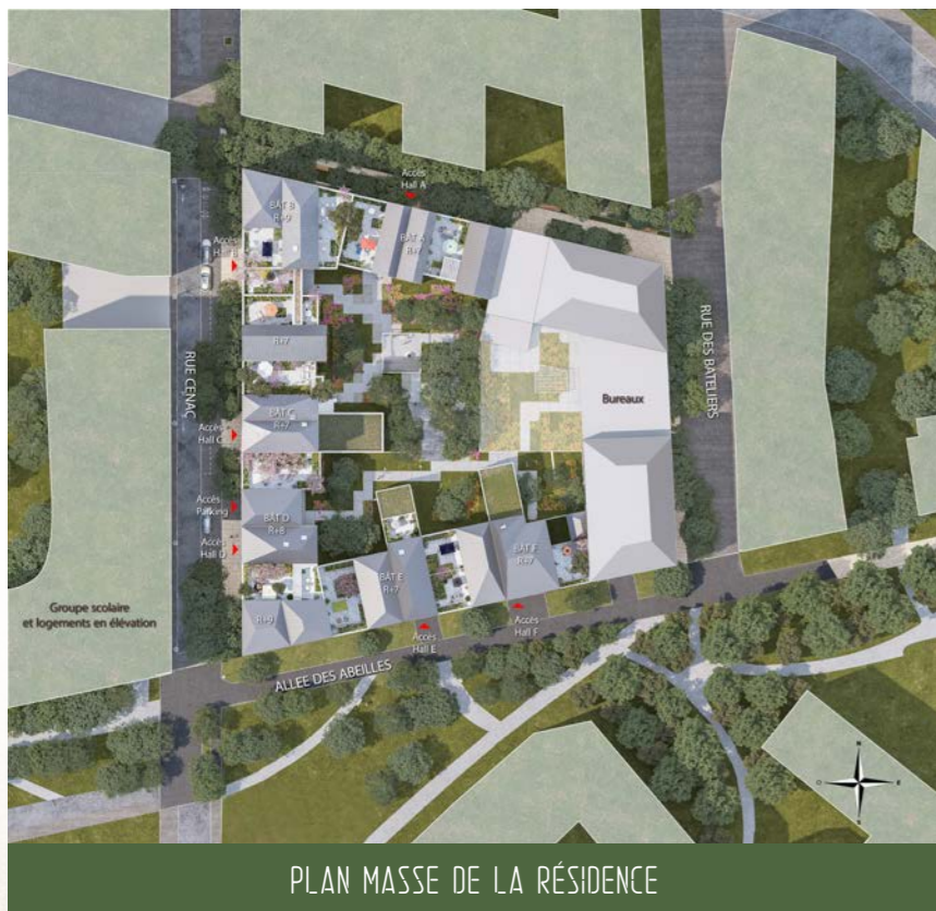
PLAN MASSE DE LA RÉSIDENCE

« C'est une bastide contemporaine qui accueille, en son cœur, un îlot paysager à partager et qui s'ouvre, en périphérie, sur la métropole bordelaise. Ce sont autant de bâtiments mitoyens accolés qui constituent l'écrin de ce jardin en ville.